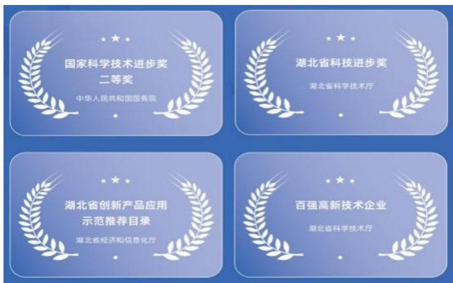
公司技术创新荣誉

经过持续不断的技术创新，公司在低温和超低温压缩机制冷技术方面，成功研发出制冷温度 -86^{\circ}\text{C} 压缩机，并实现了 -200^{\circ}\text{C} 超低温的技术突破，填补了公司轻型商用压缩机在深冷领域的空白。公司NV系列压缩机获评了中国电冰箱行业高峰论坛“深冷绿色之星”。超高效变频压缩机获全国低碳先锋产品奖，达到国际领先水平。