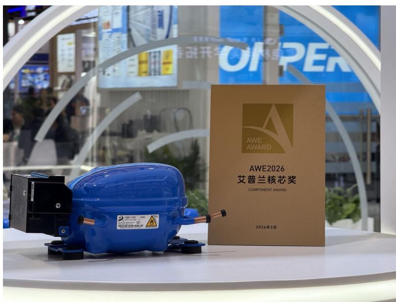
公司VQ系列扁平化高效变频压缩机

势分别获2025年度及2026年度“中国家电产业链金钉奖”。另外，公司同步推进新能源二氧化碳汽车空调压缩机、洗衣机变频电机等产品研发；创新铸件品类布局，通过开发多种高性能铸铁材料，填补多项战略品类空白。本年度，铸造汽车零部件销量占比攀升至63%，实现销量同比增长15%，展现出强劲的发展韧性；在制冷器具业务上，公司与行业头部客户共建联合研发平台，推动技术共享与需求对接，首创的膨化技术集成巴氏杀菌功能，实现该款冰淇淋机14天免清洗，以创新引领行业发展。报告期内，公司发明专利“共鸣腔式吸气消音器及制冷压缩机”获“第四届湖北省高价值专利大赛优秀奖”；“静音型高效智能变频压缩机关键技术研发及应用”项目获“2025年金砖国家工业创新大赛二等奖”；同时公司入选了省经信厅“2025年省级制造业中试平台培育名单”。