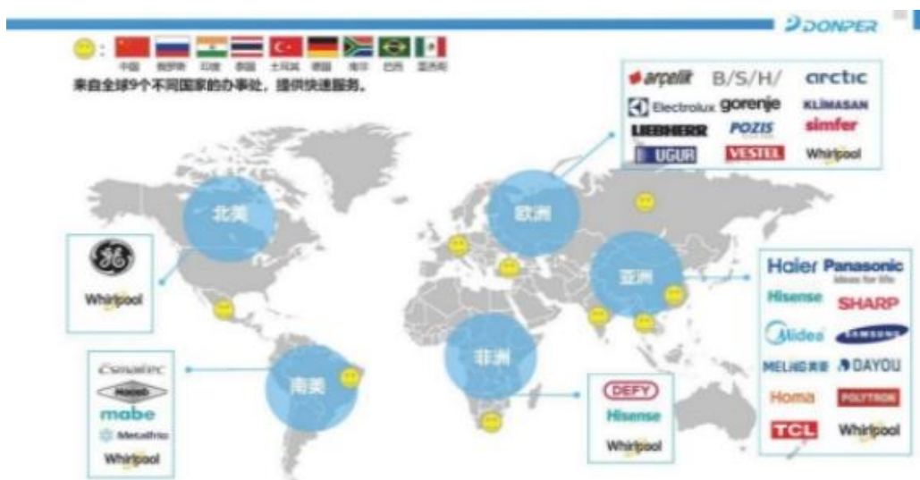
东贝全球服务网点及客户群

公司在生产过程全流程管理中， 以客户定制的柔性化生产模式为主 ，满足了全球不同国家和地区客户的不同设计需求。通过对生产系统的 全过程精细化管理 ，实现 客户无差异化交付 ，并运用精益工具对生产过程进行疏通，提升了生产效率和客户交付体验。