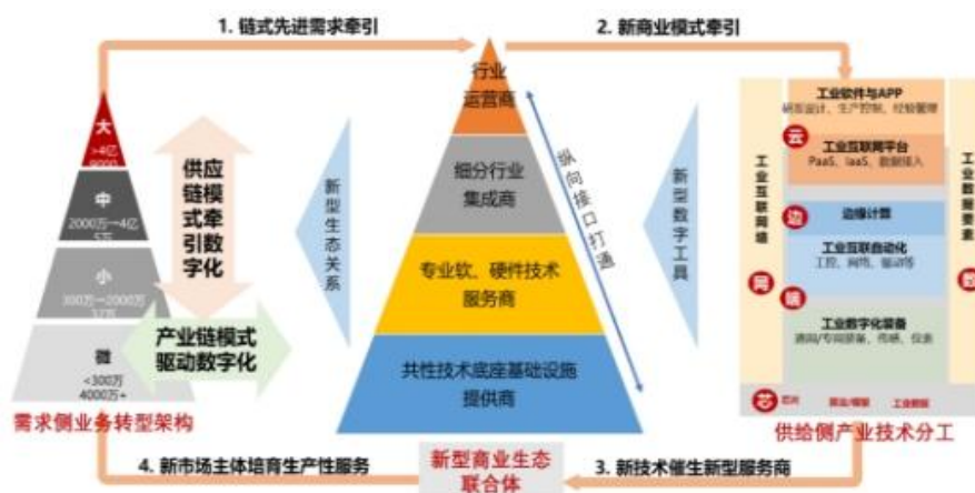
“链式”数转打造新型生态商业联合体

通过提高设备的自动化水平来提高生产效率，解决了人力成本走高、规模化生产后报价降低等制约生产经营瓶颈问题，降低生产成本，从而增强了综合竞争力。在实施机器取代人工、工艺流程优化、管理模式信息化等一系列措施后，公司摆脱了过去完全依靠人工的传统操作模式，将员工从高强度、单调重复的作业中解放出来，有效降低了劳动力成本。