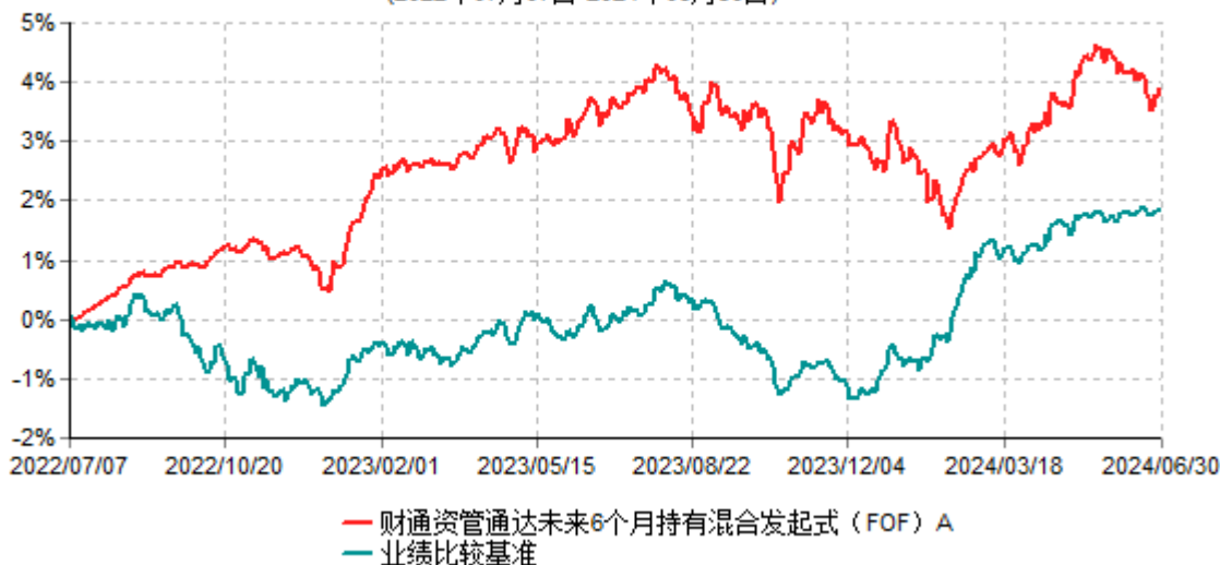
财通资管通达未来6个月持有混合发起式（FOF）A累计净值增长率与业绩比较基准收益率历史走势对比图 (2022年07月07日-2024年06月30日)