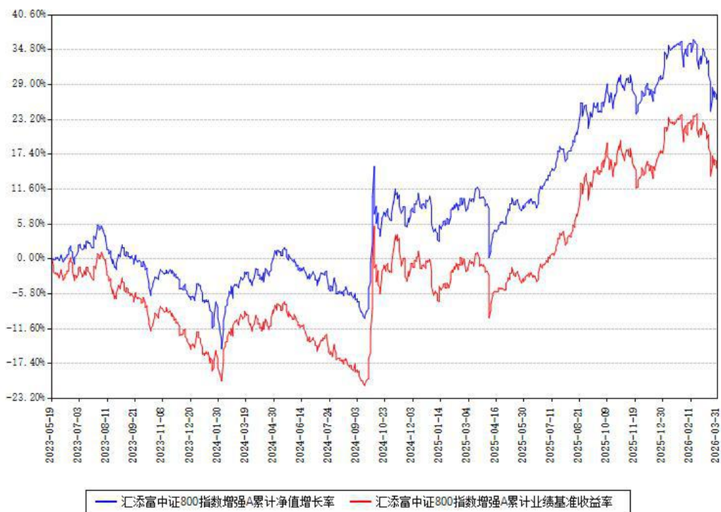
汇添富中证800指数增强A累计净值增长率与同期业绩基准收益率对比图