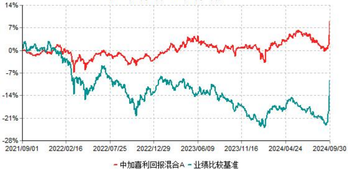
中加喜利回报混合A累计净值增长率与业绩比较基准收益率历史走势对比图 (2021年09月01日-2024年09月30日)