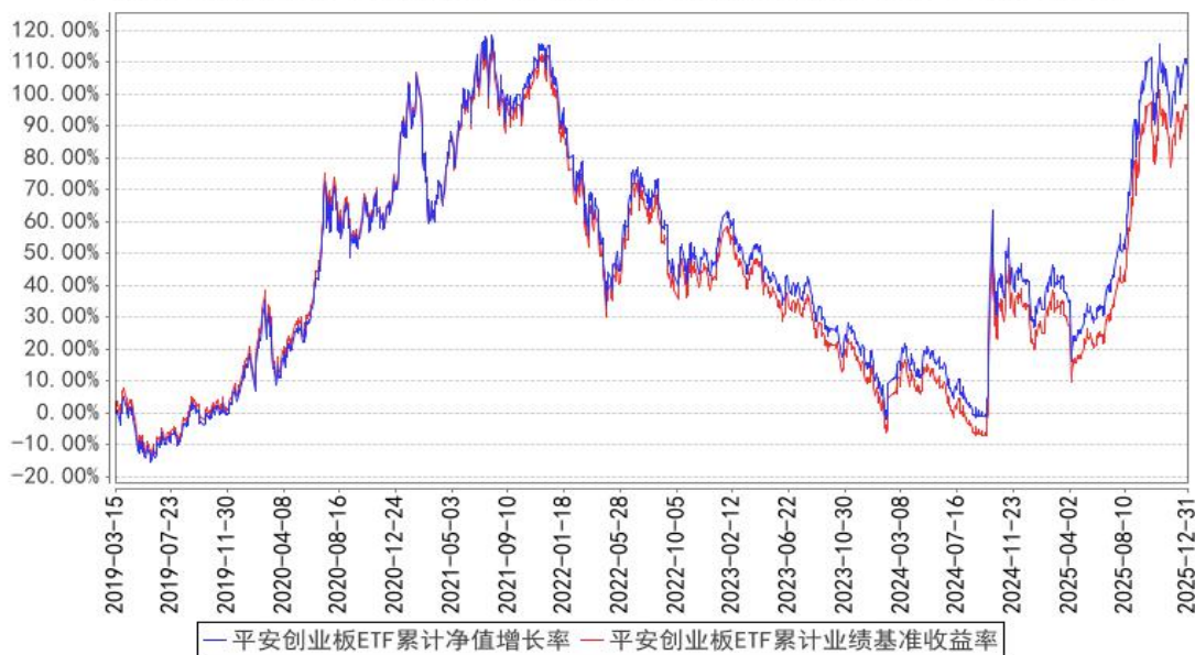
平安创业板ETF累计净值增长率与同期业绩比较基准收益率的历史走势对比图

注：1、本基金基金合同于 2019 年 03 月 15 日正式生效； 2、按照本基金的基金合同规定，基金管理人应当自基金合同生效之日起六个月内使基金的投资组合比例符合基金合同的约定，截至报告期末本基金已完成建仓，建仓期结束时各项资产配置比例符合合同约定。