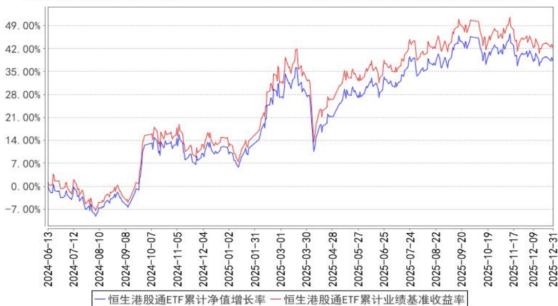
恒生港股通ETF累计净值增长率与同期业绩比较基准收益率的历史走势对比图

注：按基金合同的规定，本基金自基金合同生效起六个月内为建仓期，建仓期结束时本基金的各项投资比例已达到基金合同的规定：本基金主要投资于标的指数成份股及备选成份股。在建仓完成后，本基金投资于标的指数成份股及备选成份股的资产不低于基金资产净值的90%，且不低于非现金基金资产的80%。每个交易日日终在扣除股指期货合约、股票期权合约需缴纳的交易保证金后，应当保持不低于交易保证金一倍的现金，其中，现金不包括结算备付金、存出保证金和应收申购款等，因法律法规的规定而受限制的情形除外。