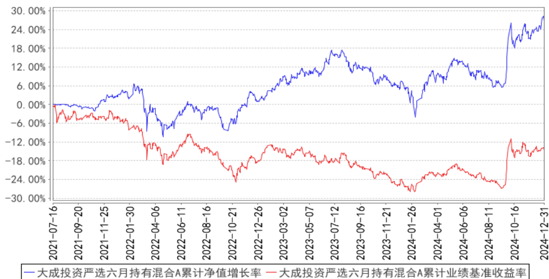
大成投资严选六月持有混合A累计净值增长率与同期业绩比较基准收益率的历史走势对比图