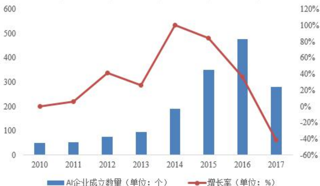
图表 5.27 我国人工智能企业数量情况

从企业数量来看，我国人工智能企业 2013 年之后呈现爆发式增长，并在 2016 年达到了近年来的高点，企业数量的增多使得行业竞争逐步加剧，2017 年以来市场投资更为理性，企业数量略有下降。