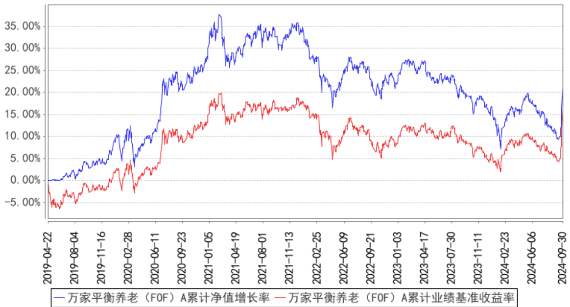
万家平衡养老(FOF)A累计净值增长率与同期业绩比较基准收益率的历史走势对比图

(二) 自基金合同生效以来基金累计净值增长率变动及其与同期业绩比较基准收益率变动的比较