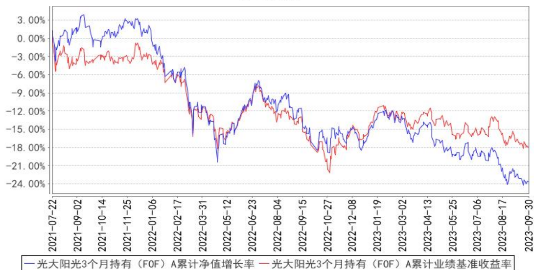
光大阳光3个月持有（FOF）A 累计净值增长率与同期业绩比较基准收益率的历史走势对比图