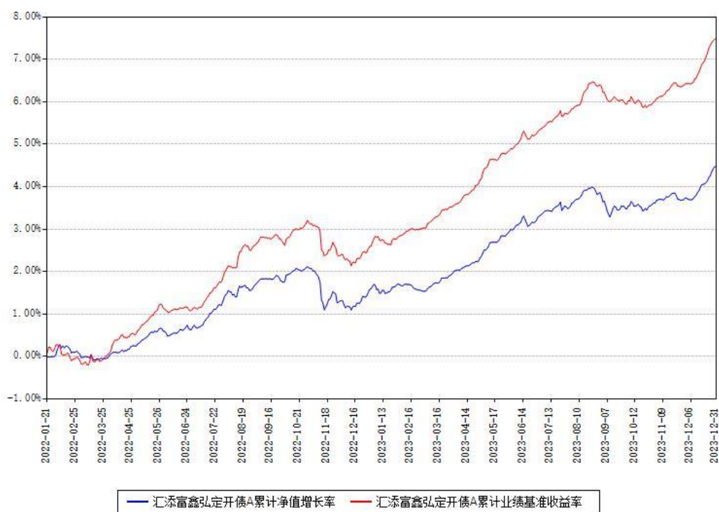
汇添富鑫弘定开债A累计净值增长率与同期业绩基准收益率对比图

注：本基金建仓期为本《基金合同》生效之日（2022年01月21日）起6个月，建仓期结束时各项资产配置比例符合合同约定。