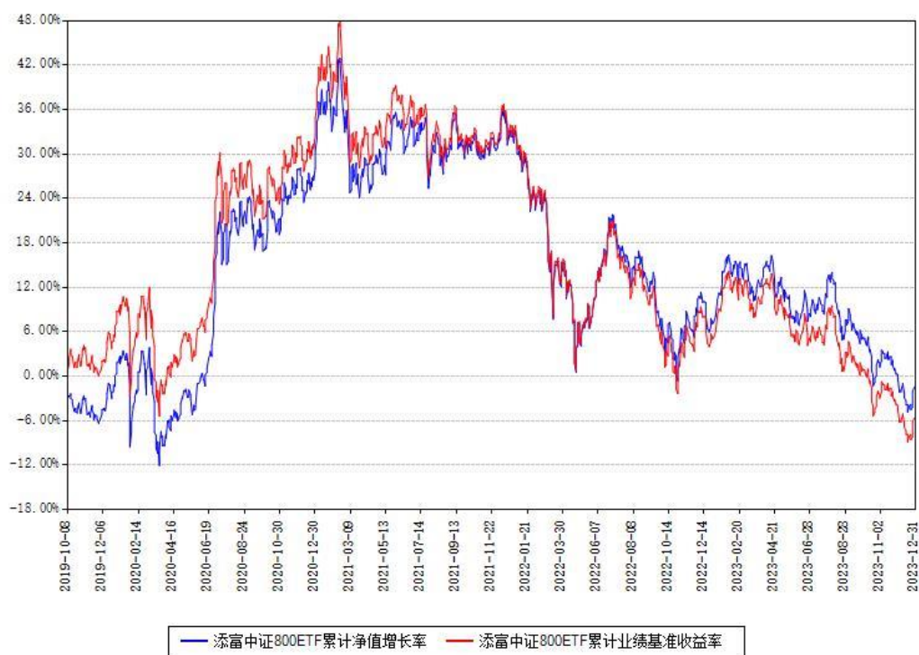
添富中证800ETF累计净值增长率与同期业绩基准收益率对比图

注：本基金建仓期为本《基金合同》生效之日（2019年10月08日）起6个月，建仓期结束时各项资产配置比例符合合同约定。