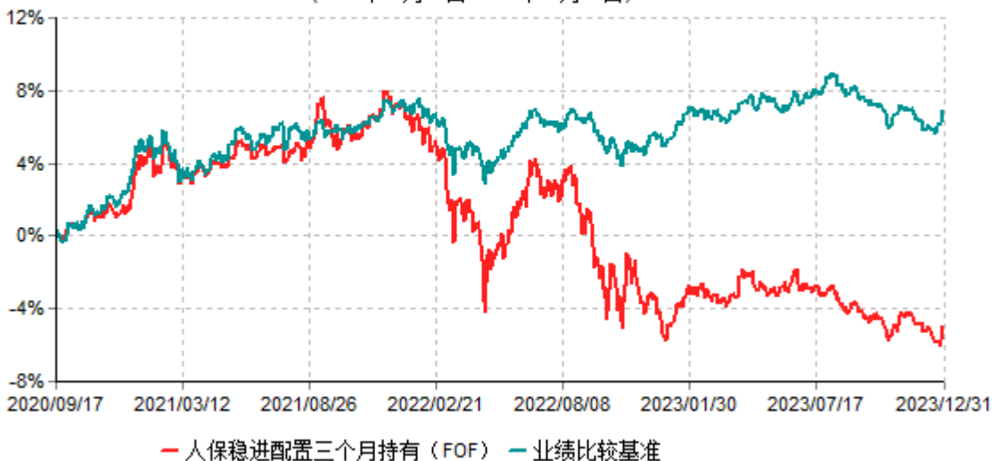
人保稳进配置三个月持有期混合型基金中基金(FOF)累计净值增长率与业绩比较基准收益率 历史走势对比图 (2020年09月17日-2023年12月31日)

注：1、本基金基金合同于2020年09月17日生效。根据基金合同规定，本基金建仓期为6个月，建仓期结束，本基金的各项投资比例符合基金合同的有关约定。