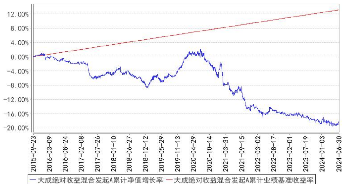
大成绝对收益混合发起A累计净值增长率与同期业绩比较基准收益率的历史走势对比图

(二) 自基金合同生效以来基金份额累计净值增长率变动及其与同期业绩比较基准收益率变动的比较