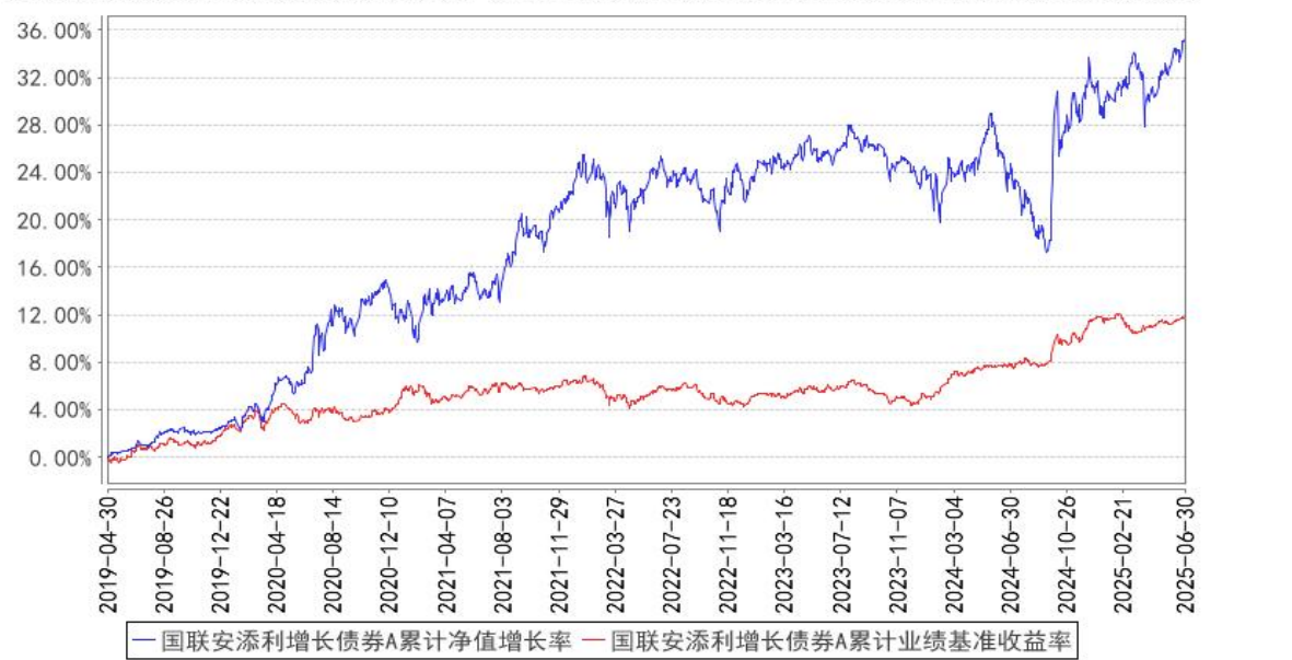
国联安添利增长债券A累计净值增长率与同期业绩比较基准收益率的历史走势对比图

注：1、本基金的业绩比较基准为： 中债综合指数收益率×90%+沪深 300 指数收益率×10%； 2、本基金基金合同于 2019 年 4 月 30 日生效； 3、本基金建仓期为自基金合同生效之日起的 6 个月，建仓期结束时各项资产配置符合合同约定。