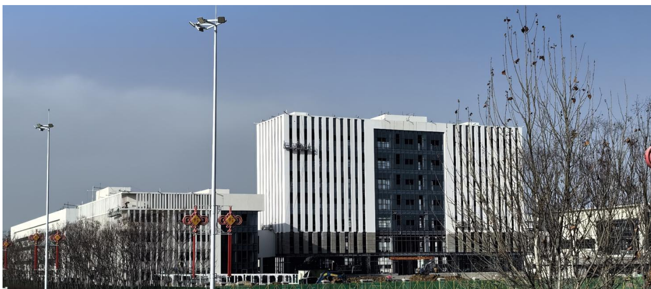
南阳仲景食品产业园一期项目实景图（建设中）