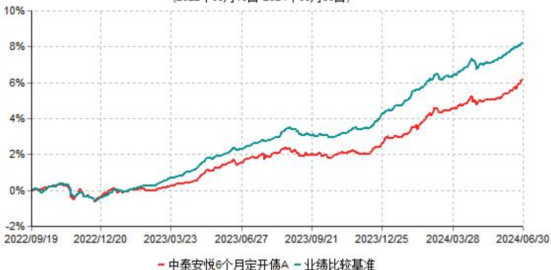
中泰安悦6个月定开债A累计净值增长率与业绩比较基准收益率历史走势对比图 (2022年09月19日-2024年06月30日)