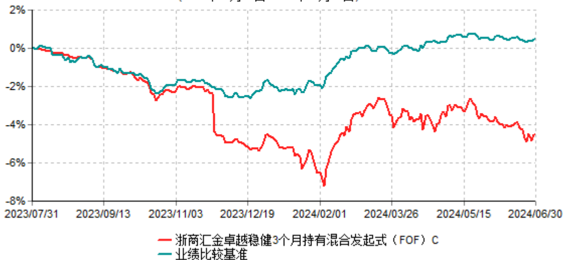
浙商汇金卓越稳健3个月持有混合发起式（FOF）C累计净值增长率与业绩比较基准收益率历史走势对比图 (2023年07月31日-2024年06月30日)

注：本基金的基金合同生效日为2023年07月31日，自基金合同生效日起至本报告期末不足一年。至本报告期末，本基金已完成建仓，但报告期末距建仓结束不满一年，建仓期为2023年07月31日-2024年01月30日，本基金建仓期结束时各项资产配置比例符合合同的约定。