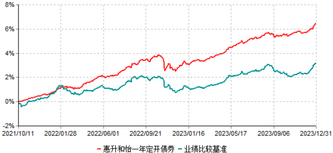
惠升和怡一年定期开放债券型发起式证券投资基金累计净值增长率与业绩比较基准收益率历史走势对比图 (2021年10月11日-2023年12月31日)