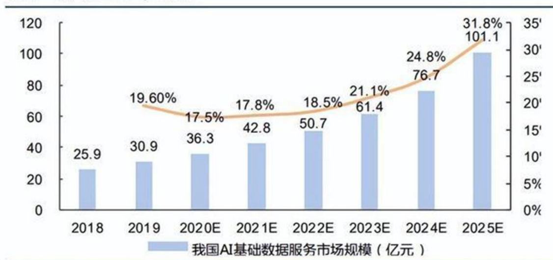
图表10: 2025 年我国 AI 基础数据服务市场或达 101 亿元，相较 22 年翻倍