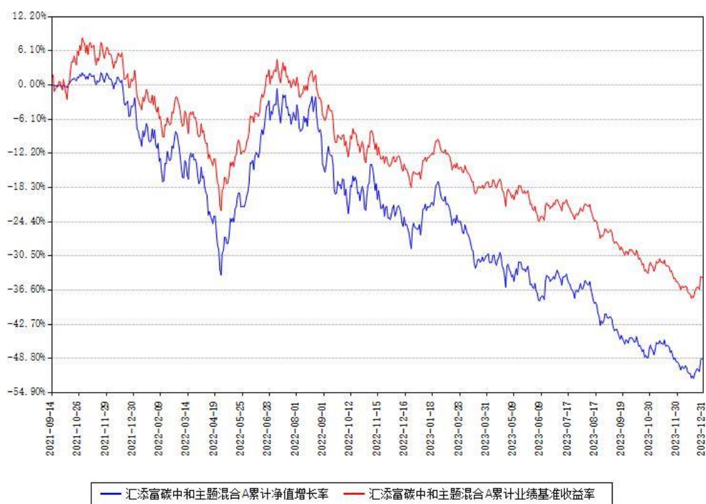
汇添富碳中和主题混合A累计净值增长率与同期业绩基准收益率对比图