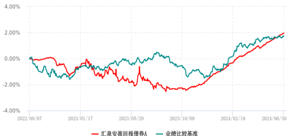
汇泉安盈回报债券A累计净值增长率与业绩比较基准收益率历史走势对比图 (2022年09月07日-2024年06月30日)