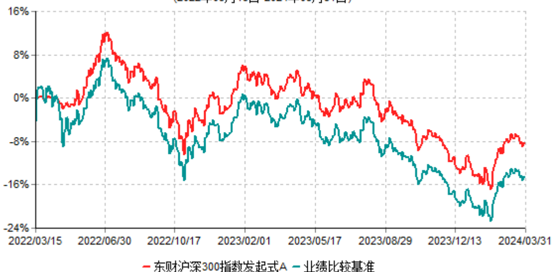
东财沪深300指数发起式A累计净值增长率与业绩比较基准收益率历史走势对比图 (2022年03月15日-2024年03月31日)