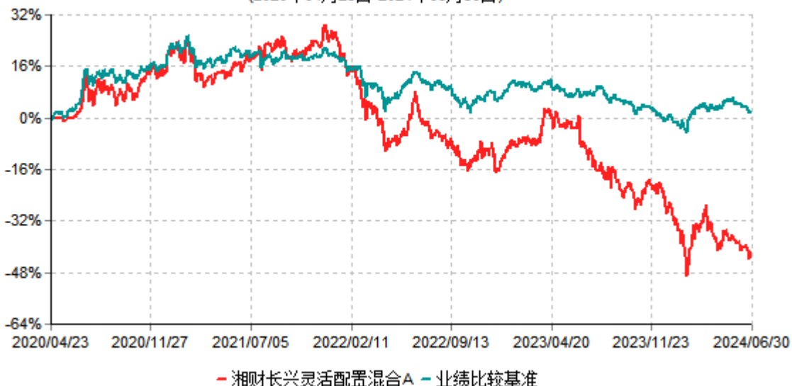
湘财长兴灵活配置混合A累计净值增长率与业绩比较基准收益率历史走势对比图 (2020年04月23日-2024年06月30日)