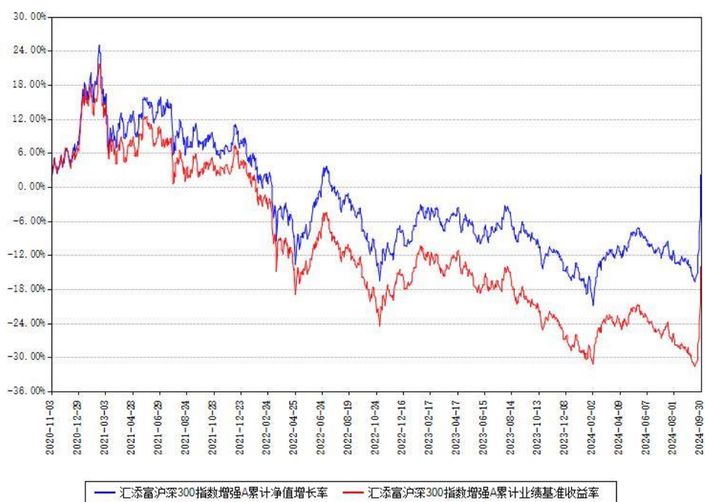
汇添富沪深300指数增强A累计净值增长率与同期业绩基准收益率对比图