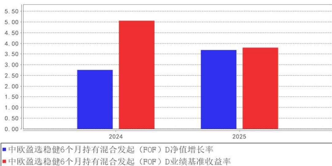
中欧盈选稳健6个月持有混合发起（FOF）D基金每年净值增长率与同期业绩比较基准收益率的对比图

注：2024年3月28日本基金新增D份额，2024年度数据为2024年4月2日至2024年12月31日数据。