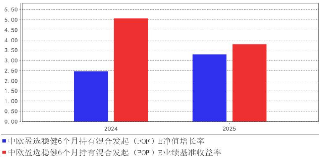
中欧盈选稳健6个月持有混合发起（FOF）E基金每年净值增长率与同期业绩比较基准收益率的对比图

注：2024 年 3 月 28 日本基金新增 E 份额，2024 年度数据为 2024 年 4 月 2 日至 2024 年 12 月 31 日数据。