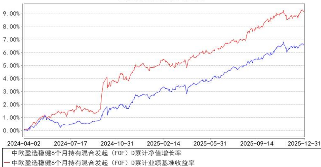
中欧盈选稳健6个月持有混合发起（FOF）D累计净值增长率与同期业绩比较基准收益率的历史走势对比图

注：2024年8月19日起，组合业绩比较基准变更为中证纯债债券型基金指数收益率*87%+沪深300指数收益率*10%+上海黄金交易所 Au99.99 现货实盘合约收益率*3%。本基金于2024年3月28日新增D类份额，图示日期为2024年4月2日至2025年12月31日。