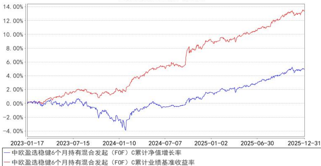
中欧盈选稳健6个月持有混合发起（FOF）C累计净值增长率与同期业绩比较基准收益率的历史走势对比图

注：2024年8月19日起，组合业绩比较基准变更为中证纯债债券型基金指数收益率*87%+沪深300指数收益率*10%+上海黄金交易所 Au99.99 现货实盘合约收益率*3%。