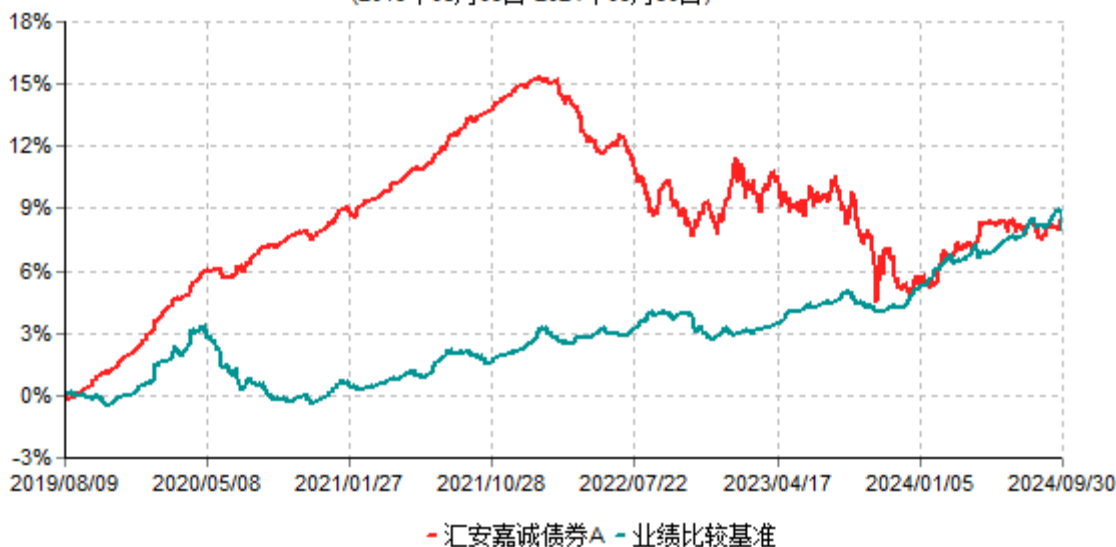
汇安嘉诚债券A累计净值增长率与业绩比较基准收益率历史走势对比图 (2019年08月09日-2024年09月30日)