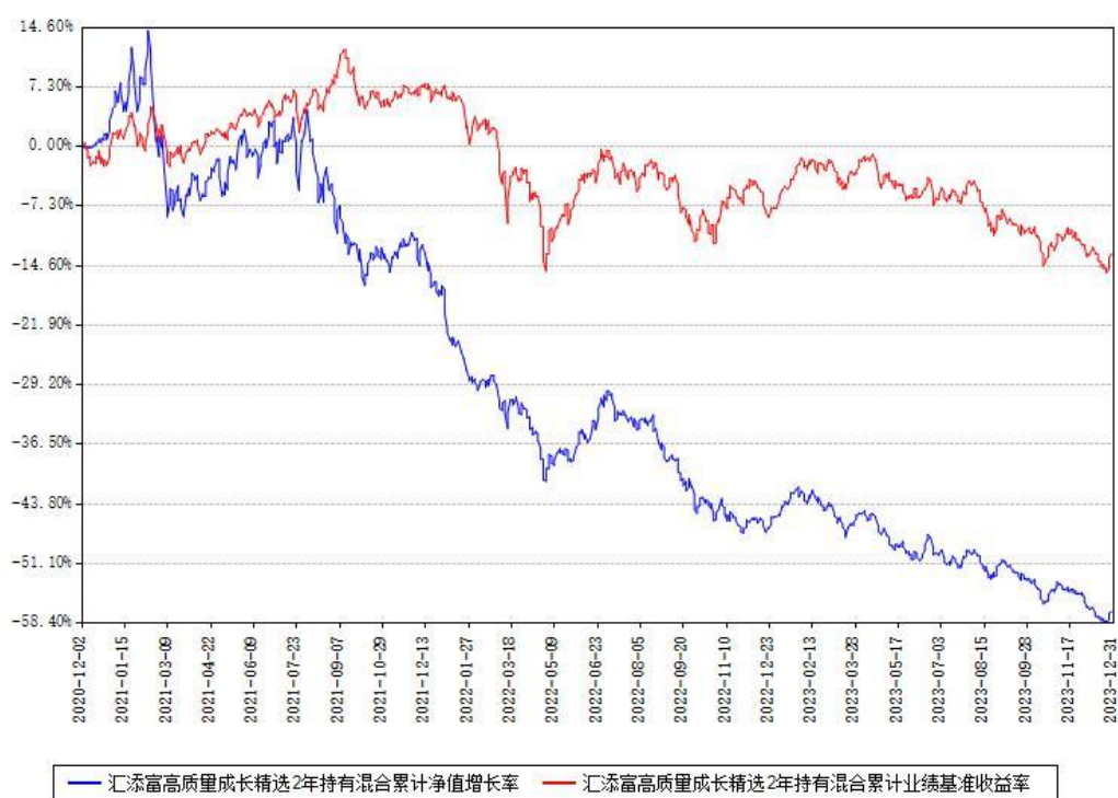
汇添富高质量成长精选2年持有混合累计净值增长率与同期业绩比较基准收益率对比图

注：本基金建仓期为本《基金合同》生效之日（2020年12月02日）起6个月，建仓期结束时各项资产配置比例符合合同约定。