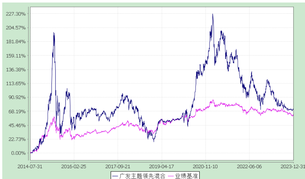
广发主题领先灵活配置混合型证券投资基金 份额累计净值增长率与业绩比较基准收益率的历史走势对比图 (2014 年 7 月 31 日至 2023 年 12 月 31 日)

注：自 2019 年 11 月 7 日起，本基金的业绩比较基准由“沪深 300 指数×50%+中证全债指数×50%”变更为“沪深 300 指数×40%+中债-综合财富（总值）指数×50%+银行活期存款利率（税后）×10%”。