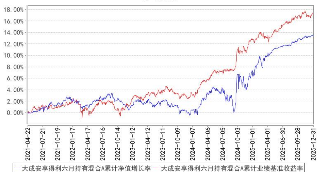
大成安享得利六月持有混合A累计净值增长率与同期业绩比较基准收益率的历史走势对比图

(二) 自基金合同生效以来基金份额累计净值增长率变动及其与同期业绩比较基准收益率变动的比较