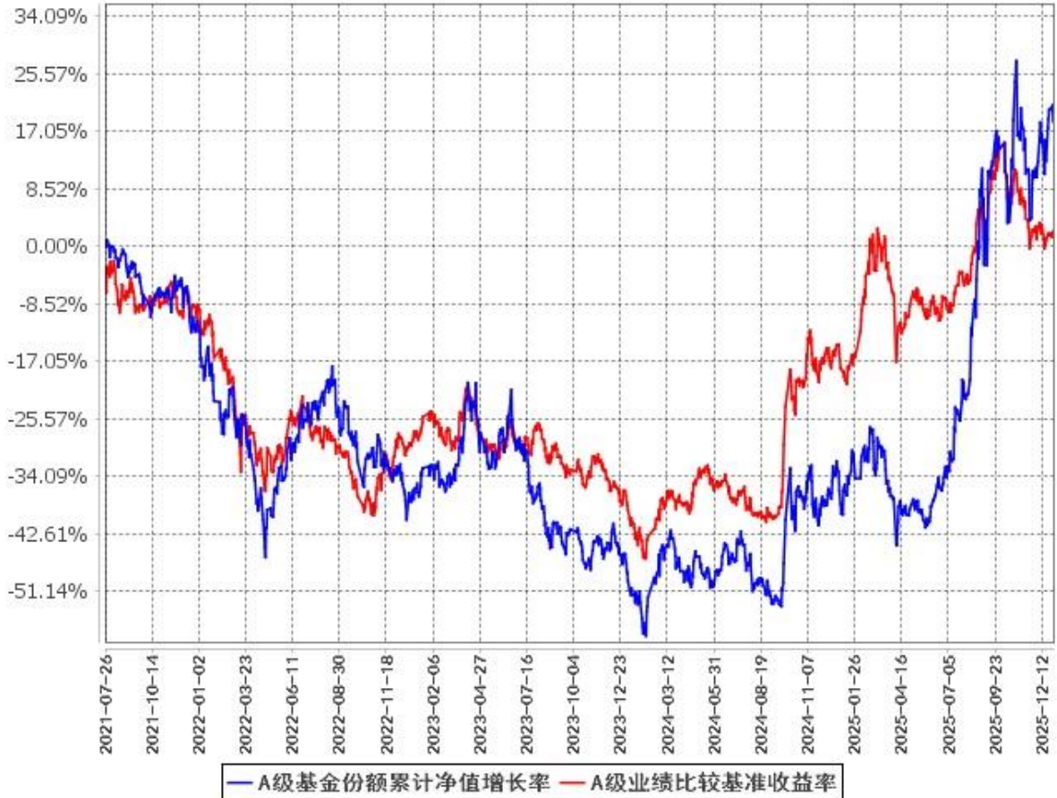
A级基金份额累计净值增长率与同期业绩比较基准收益率的历史走势对比图 (2021年7月26日至2025年12月31日)