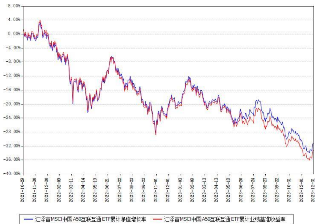
汇添富 MSCI 中国 A50 互联互通 ETF 累计净值增长率与同期业绩比较基准收益率对比图

注：本基金建仓期为本《基金合同》生效之日（2021年10月29日）起6个月，建仓期结束时各项资产配置比例符合合同约定。