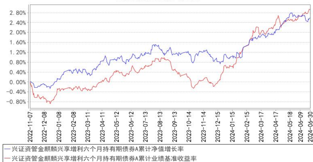
兴证资管金麒麟兴享增利六个月持有期债券A累计净值增长率与同期业绩比较基准收益率的历史走势对比图