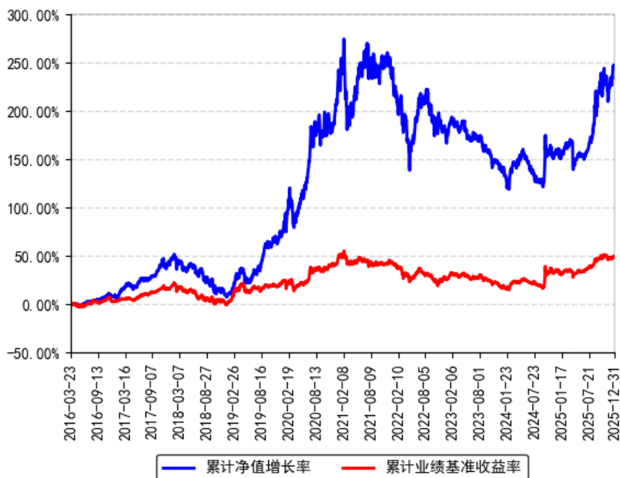
南方转型驱动灵活配置混合累计净值增长率与同期业绩比较基准收益率的历史走势对比图