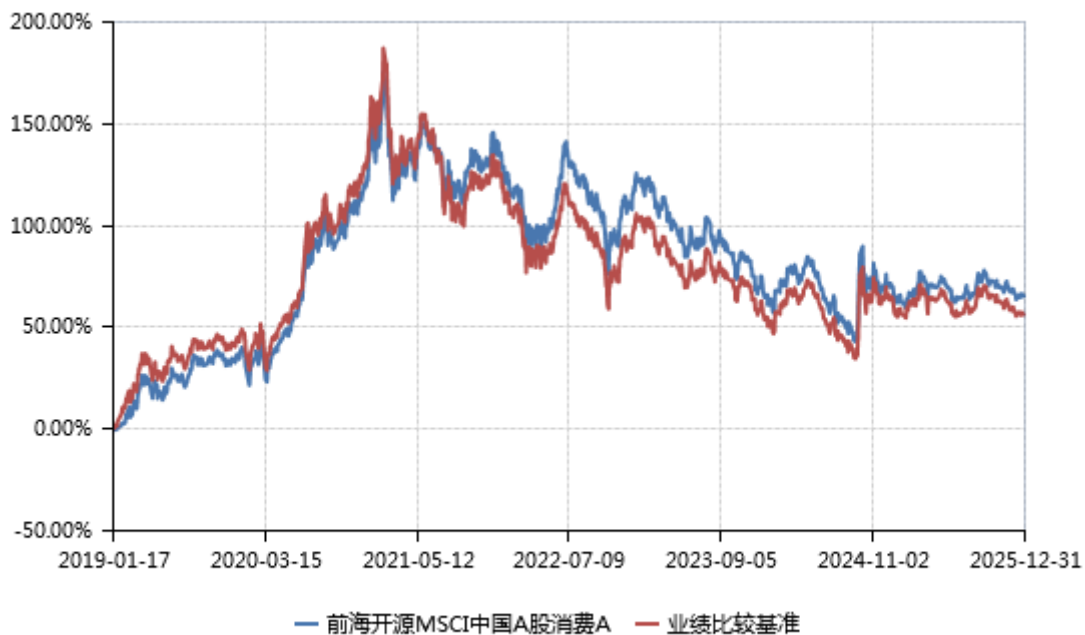
前海开源 MSCI 中国 A 股消费 C