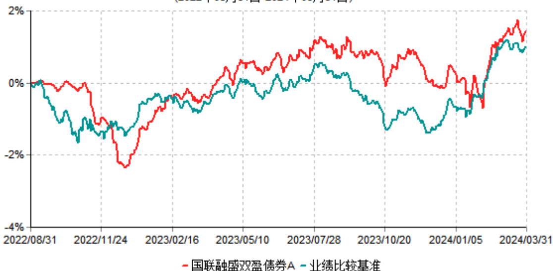
国联融盛双盈债券A累计净值增长率与业绩比较基准收益率历史走势对比图 (2022年08月31日-2024年03月31日)