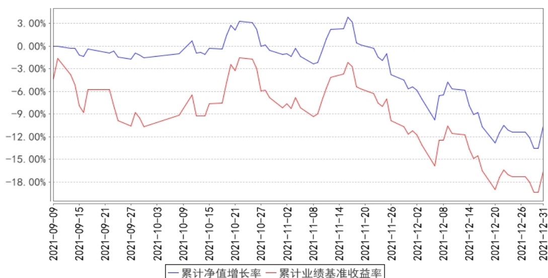
大成恒生科技ETF发起式联接A累计净值增长率与同期业绩比较基准收益率的历史走势对比图