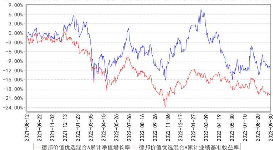
德邦价值优选混合A累计净值增长率与同期业绩比较基准收益率的历史走势对比图