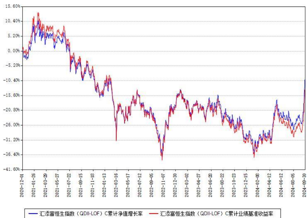
汇添富恒生指数 (QDII-LOF) C 累计净值增长率与同期业绩基准收益率对比图