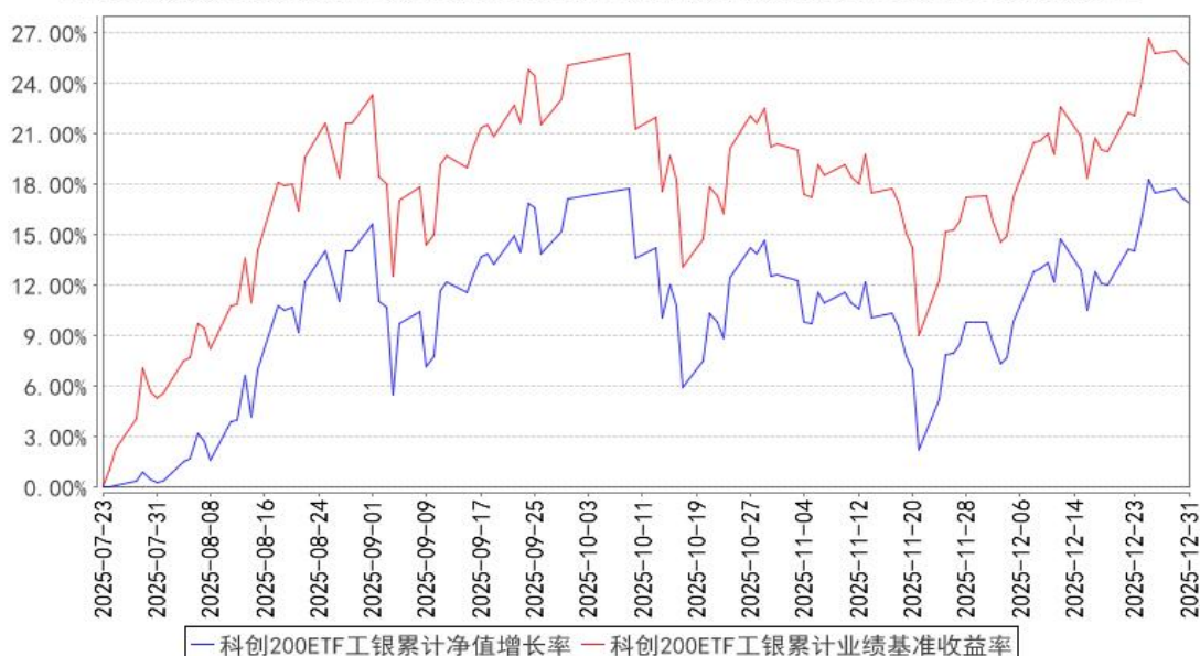
科创200ETF工银累计净值增长率与同期业绩比较基准收益率的历史走势对比图

注：1、本基金基金合同于 2025 年 7 月 23 日生效。截至报告期末，本基金尚处于建仓期。