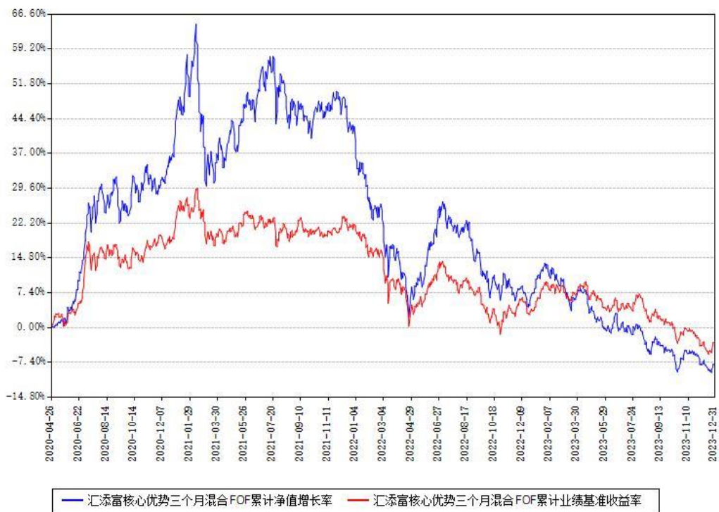
汇添富核心优势三个月混合FOF累计净值增长率与同期业绩基准收益率对比图