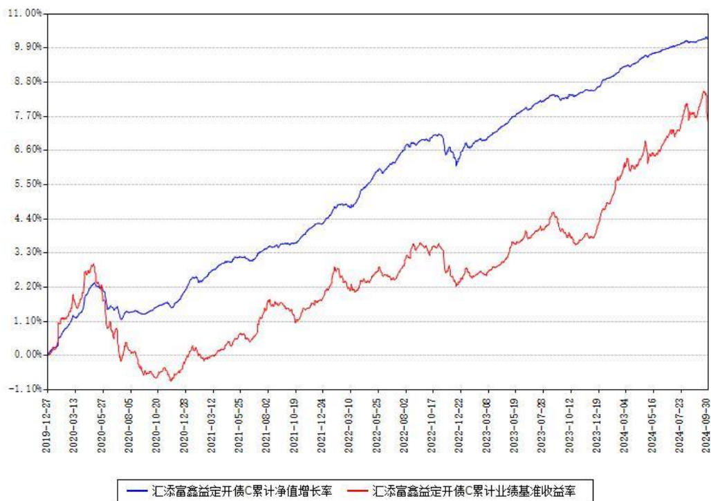
汇添富鑫益定开债C累计净值增长率与同期业绩基准收益率对比图