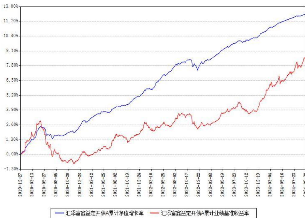
汇添富鑫益定开债A累计净值增长率与同期业绩基准收益率对比图