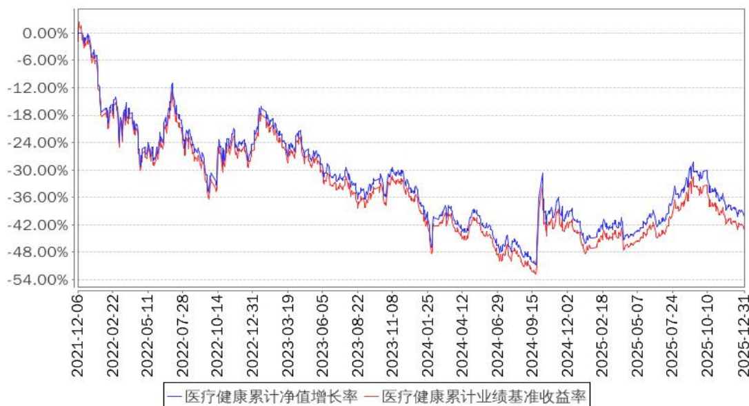
医疗健康累计净值增长率与同期业绩比较基准收益率的历史走势对比图