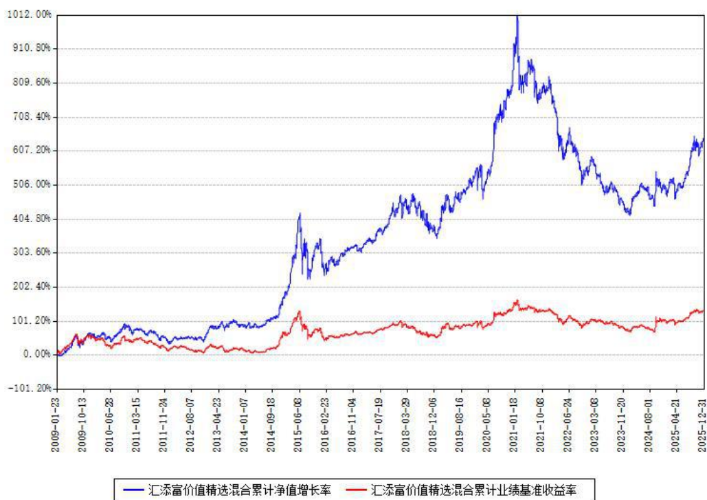
汇添富价值精选混合累计净值增长率与同期业绩基准收益率对比图

注：本基金建仓期为本《基金合同》生效之日（2009年01月23日）起6个月，建仓期结束时各项资产配置比例符合合同约定。