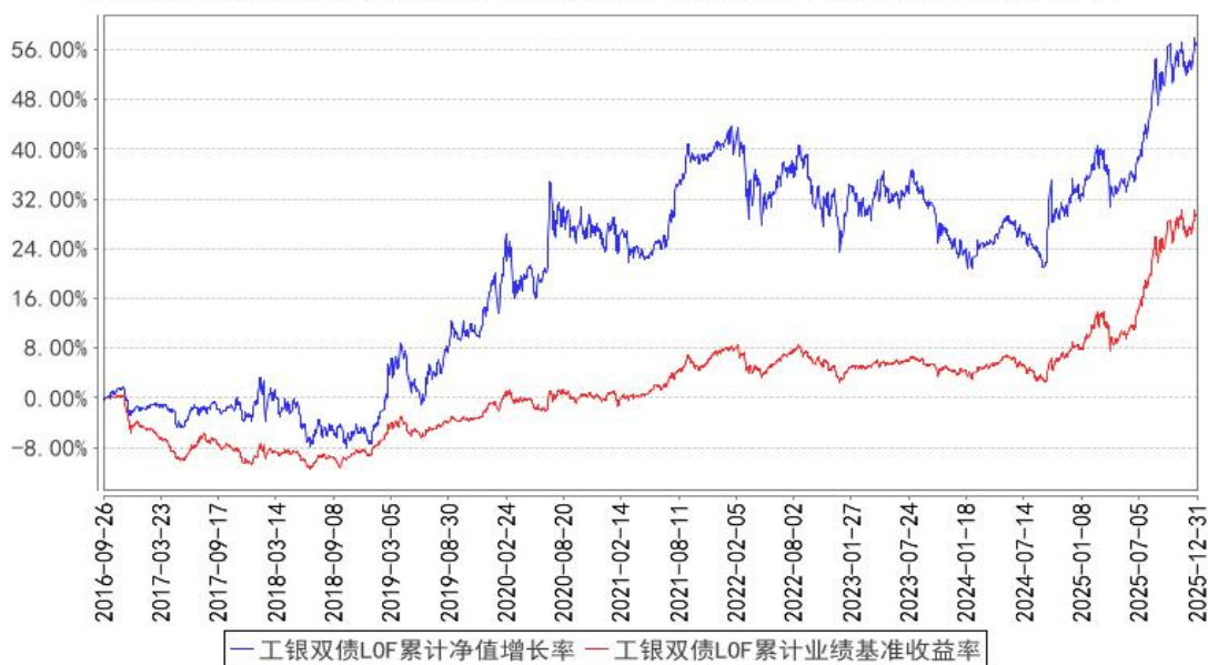
工银双债LOF累计净值增长率与同期业绩比较基准收益率的历史走势对比图

注：1、本基金于 2016 年 9 月 26 日由“工银瑞信双债增强债券型证券投资基金”转型而来。