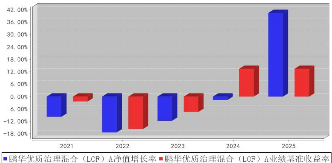
鹏华优质治理混合 (LOF) A 基金每年净值增长率与同期业绩比较基准收益率的对比图