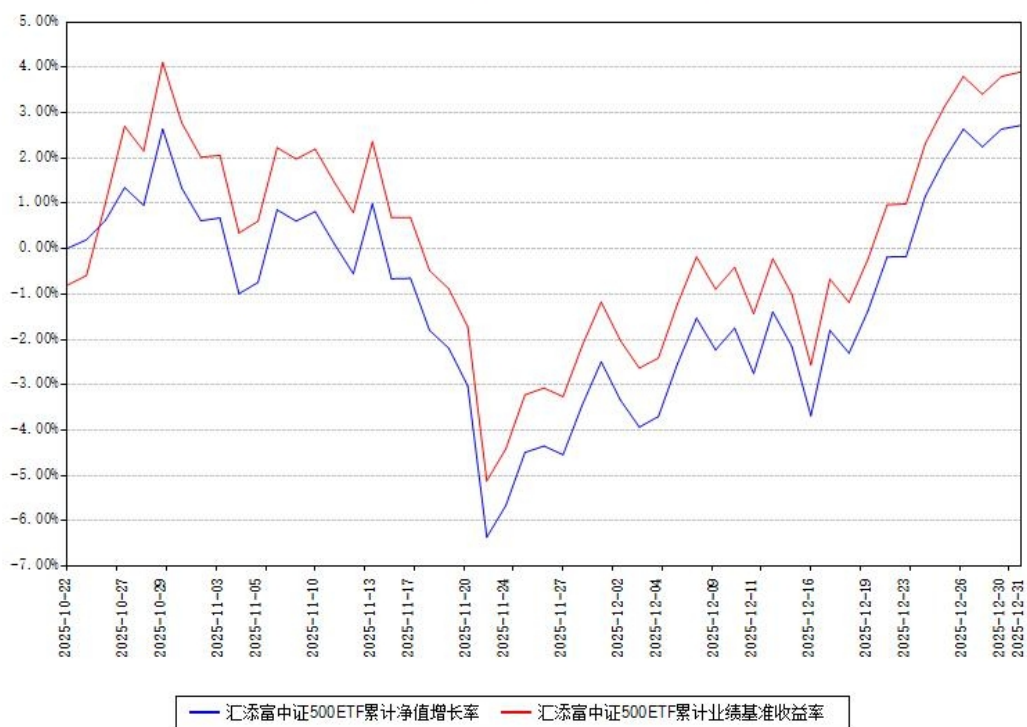
汇添富中证500ETF累计净值增长率与同期业绩基准收益率对比图

注：本《基金合同》生效之日为 2025 年 10 月 22 日，截至本报告期末，基金成立未满一年。本基金建仓期为本《基金合同》生效之日起 6 个月，截至本报告期末，本基金尚处于建仓期中。