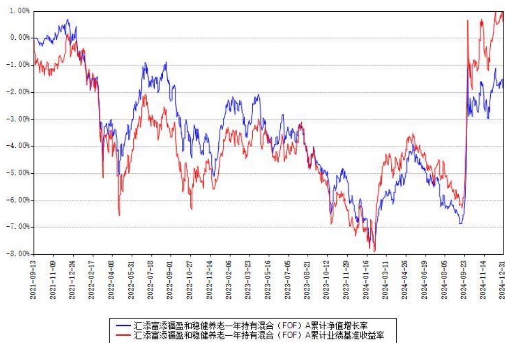
汇添富添福盈和稳健养老一年持有混合（FOF）Y 累计净值增长率与同期业绩基准收益率对比图