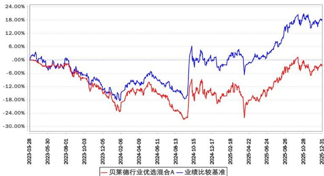
贝莱德行业优选混合A累计净值增长率与同期业绩比较基准收益率的历史走势对比图