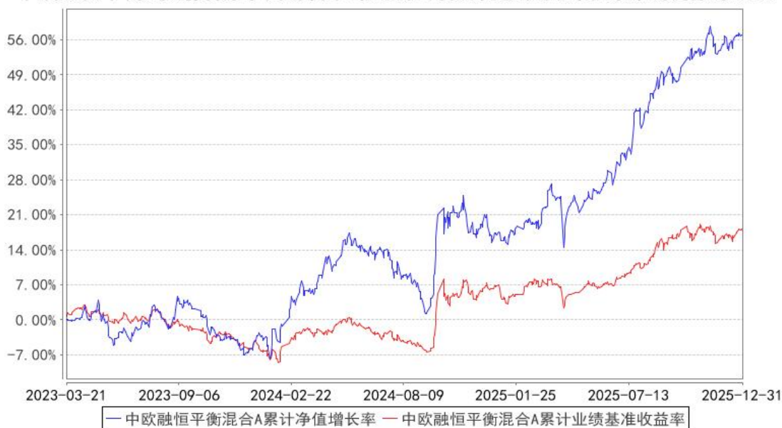
中欧融恒平衡混合A累计净值增长率与同期业绩比较基准收益率的历史走势对比图