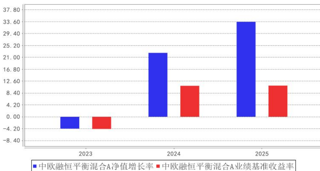
中欧融恒平衡混合A基金每年净值增长率与同期业绩比较基准收益率的对比图

注：本基金合同生效日为 2023 年 3 月 21 日，2023 年度数据为 2023 年 3 月 21 日至 2023 年 12 月 31 日数据。